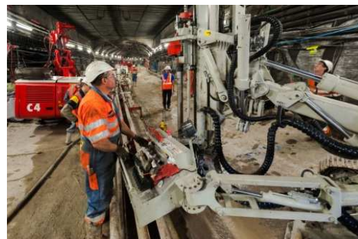
Travaux de jet grouting

Cet été sera la vingtième édition des travaux de confortement, entamés en 1996.