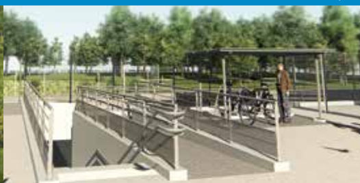
Intentions d'aménagement - Images non contractuelles