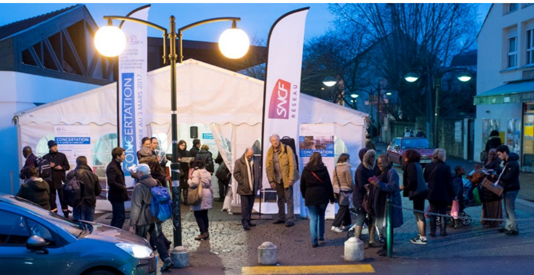
> LA RENCONTRE DE PROXIMITÉ À PONTAULT-COMBAULT