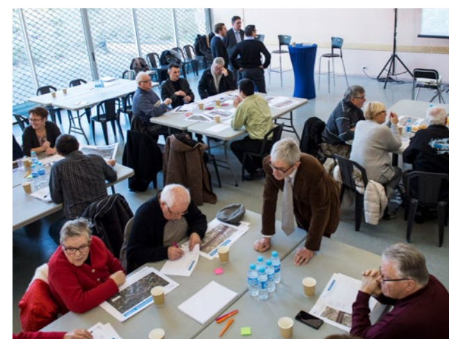
> L'ATELIER RIVERAINS À VILLIERS-SUR-MARNE