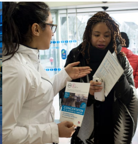
> LA RENCONTRE VOYAGEURS À ROISSY-EN-BRIE