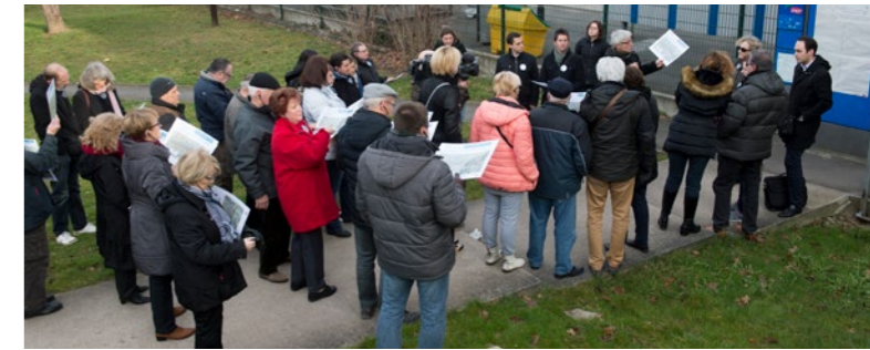
> VISITE DE TERRAIN AVEC LES RIVERAINS À NOISY-LE-GRAND